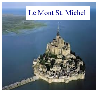
Le Mont St. Michel