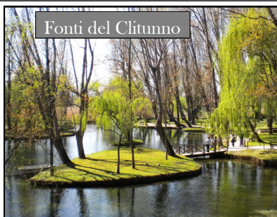
Fonti del Clitunno